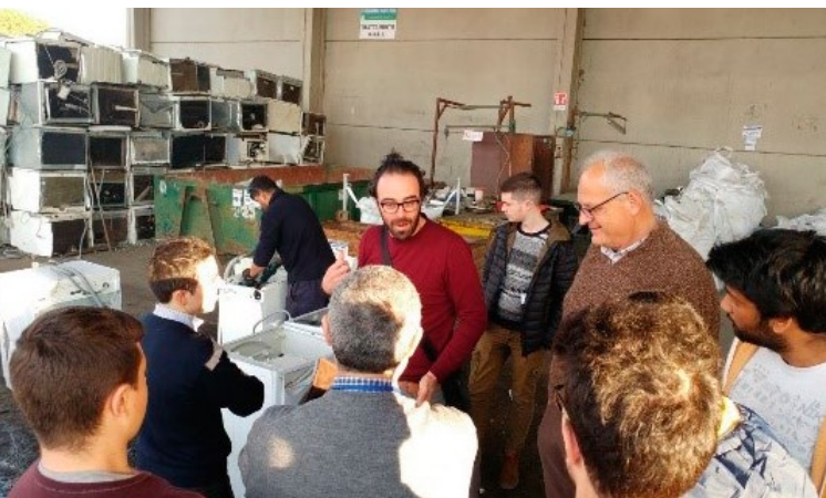
Πρακτική εξάσκηση στην Ιταλία

Η ΚΟΙΝΟΠΡΑΞΙΑ EWASTER ΑΠΟΤΕΛΕΙΤΑΙ ΑΠΟ 13 ΟΡΓΑΝΙΣΜΟΥΣ ΑΠΟ ΤΕΣΣΕΡΙΣ ΔΙΑΦΟΡΕΤΙΚΕΣ ΧΩΡΕΣ – ΚΥΠΡΟΣ, ΙΤΑΛΙΑ, ΠΟΛΩΝΙΑ ΚΑΙ ΤΟ ΗΝΩΜΕΝΟ ΒΑΣΙΛΕΙΟ. ΤΟ ΕΡΓΟ ΣΥΝΤΟΝΙΖΕΙ Ο ΟΡΓΑΝΙΣΜΟΣ E.RI.FO - ENTE PER LA RICERCA E FORMAZIONE (ROME, ITALY)