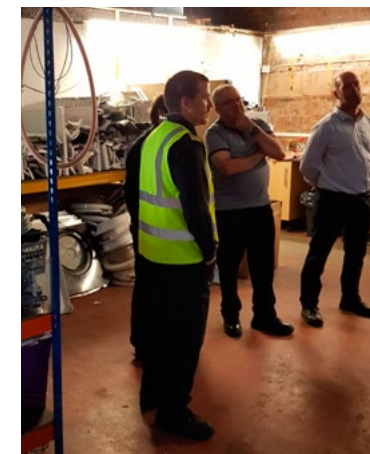
Εκπαίδευση στο Ηνωμένο Βασίλειο

Στο Ηνωμένο Βασίλειο, η εκπαίδευση έγινε από το UCLan, και περιελάμβανε διδασκαλία σε τάξη, αυτοδιδασκαλία και πρακτική εξάσκηση, καθώς επίσης και μια διαδικτυακή διάλεξη όπου συμμετείχαν εκπαιδευόμενοι από όλες τις συνεργαζόμενες χώρες. Οι εκπαιδευόμενοι ετοίμασαν δύο επιχειρηματικά μοντέλα καμβά και κατά τη διάρκεια των δραστηριοτήτων στην τάξη η λογική πίσω από το επιχειρηματικό μοντέλο καμβά αναπτύχθηκε για να συλλάβει καλύτερα τις κοινωνικές πτυχές που επηρεάζουν τους διάφορους οργανισμούς.