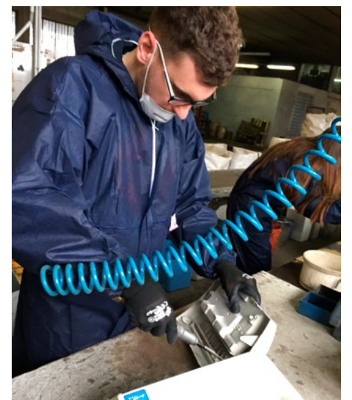
Ομάδα εκπαιδευομένων κατά τη διάρκεια εργαστηρίου πρακτικής εξάσκησης (Lab Shadowing) στην Κύπρο