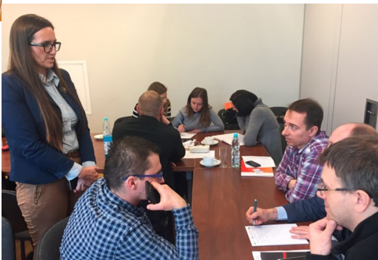
Εργασία σε ομάδες κατά τη διδασκαλία σε τάξη στην Πολωνία

Μέσω των πιλοτικών δραστηριοτήτων, οι Ιταλικοί οργανισμοί συνεργάστηκαν προκειμένου να εντοπίσουν και να αναπτύξουν κατάλληλες δράσεις που να ταιριάζουν με τη ζήτηση και σαν αποτέλεσμα να παρέχουν τις κατάλληλες δεξιότητες. Λόγω της εξαιρετικής συνεργασίας των ενδιαφερομένων μερών, οι συμμετέχοντες που ενεπλάκησαν θα έχουν εξαιρετικές ευκαιρίες στην αγορά εργασίας.